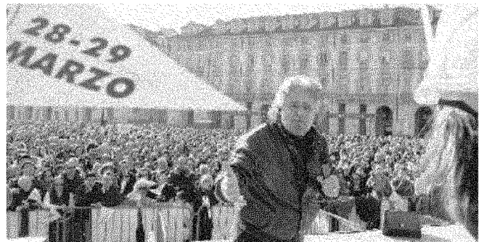
Beppe Grillo ieri in piazza Castello durante il suo comizio-spettacolo