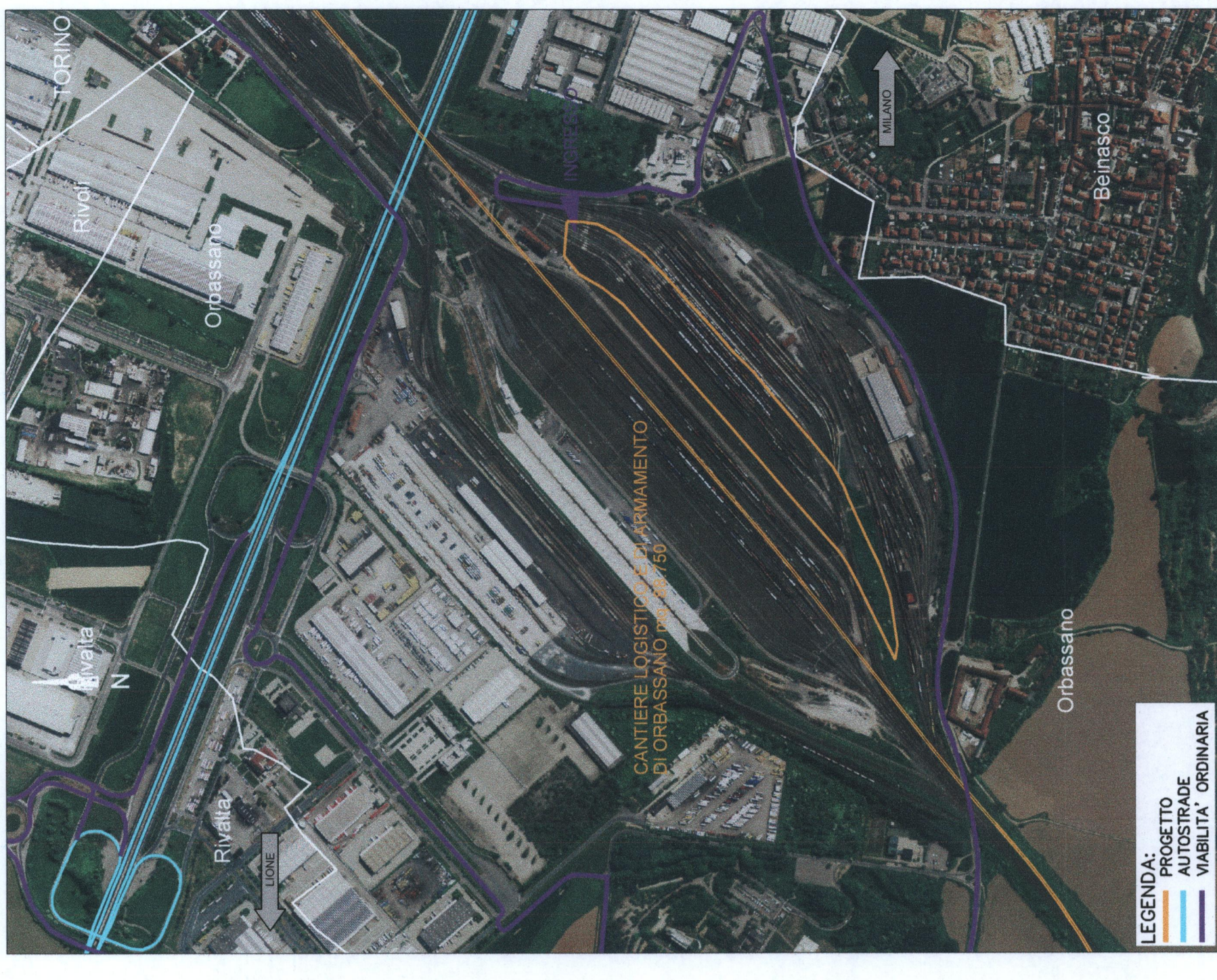
INQUADRAMENTO TERRITORIALE - 1:10000